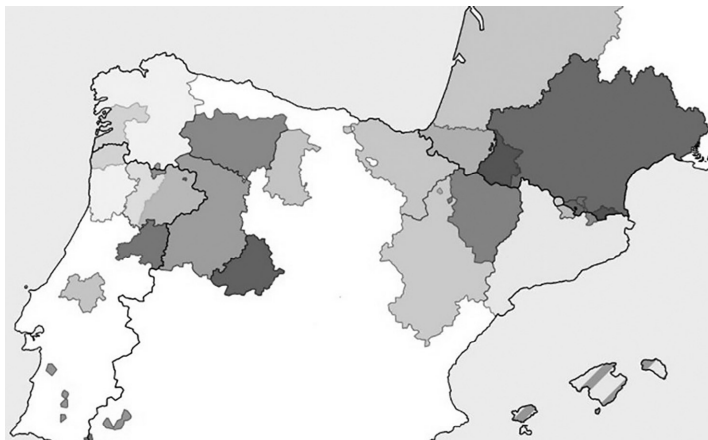
Слика 2. ЕГТС сарадње (еврорегиони) у Шпанији 2019. године